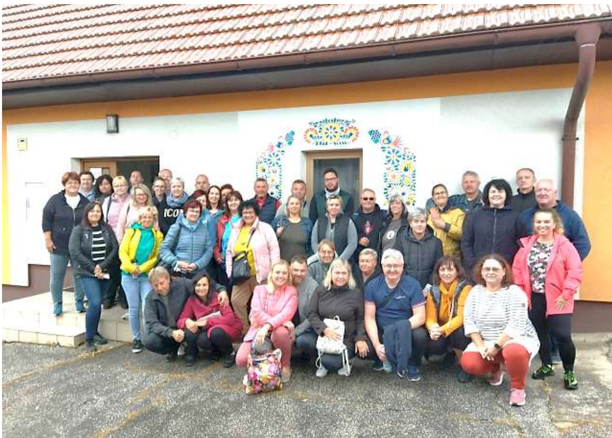
Společný snímek účastníků našeho zatím posledního odborářského zájezdu na Jižní Moravu a do Rakouska...

Text a foto: GABRIELA KUPCOVÁ Za výbor odborové organizace