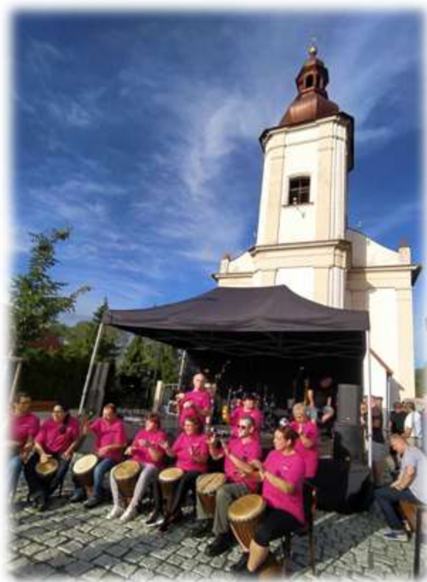
Na snímku vpravo: Skupina Rytmy při své premiéře v Heřmanicích na letošních Pivních slavnostech.