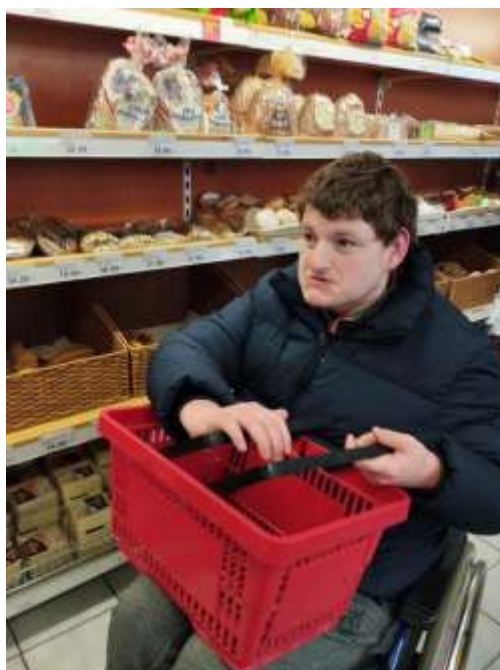
Domek Jandova